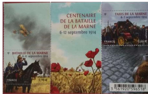
Bloc mis en vente le 15 septembre 2014 créé par Romain HUGAULT © Coll. Angéline CHERIB.

Au début de la première guerre mondiale, les Allemands, après avoir traversé la Belgique, avançaient rapidement dans le Nord de la France. La bataille de la Marne, en septembre 1914, permit aux Français et aux Anglais, grâce à la contre-offensive menée sous la direction de Joffre, de tenir en échec le plan de guerre germanique.