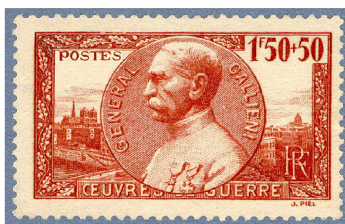
Général GALLIENI timbre du 1er mai 1940 Dessiné et gravé par Jules PIEL

Galliéni vit alors une possibilité de lancer une attaque de flanc. Suivant cette idée, dans la nuit du 4 au 5 septembre, Joffre signa l'ordre général donnant le signal de la contre-offensive.