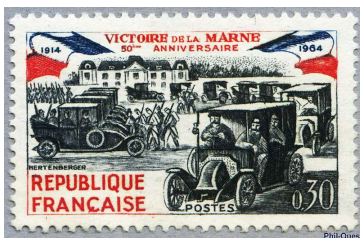
Taxis de la Marne Emis le 5 septembre 1964 Dessiné et gravé par Claude Hertenberger

Les renforts français se hâtaient vers le front et les taxis parisiens furent réquisitionnés pour transporter environ 4 000 hommes.