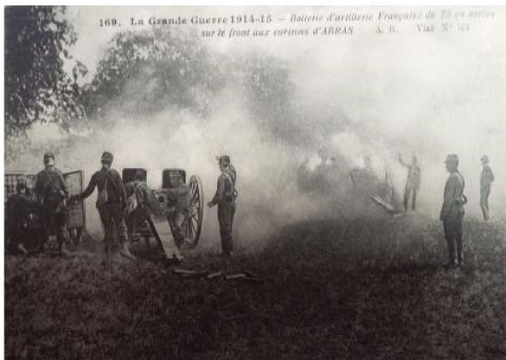
bataille de la Marne

Au début de la première guerre mondiale, les Allemands, après avoir traversé la Belgique, avançaient rapidement dans le Nord de la France. La bataille de la Marne, en septembre 1914, permit aux Français et aux Anglais, grâce à la contre-offensive menée sous la direction de Joffre, de tenir en échec le plan de guerre germanique.