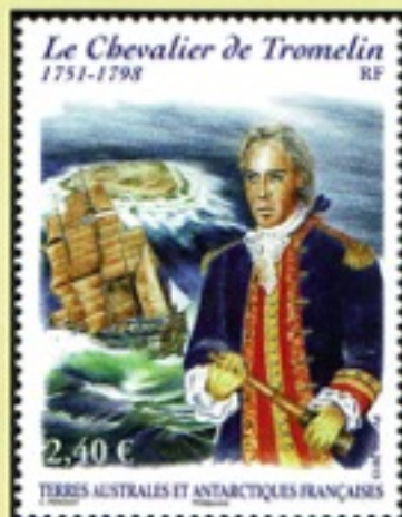
2013 - Chevalier de Tromelin (Y.T. No 646)