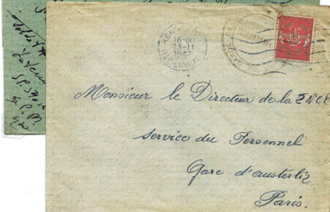
Lettre du 13/11/47 Type Emblème Rouge