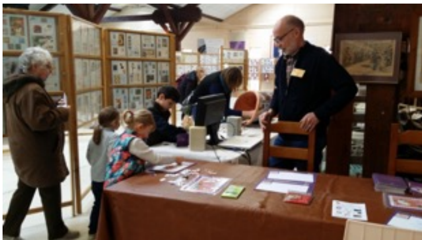
Le Club de Troyes attire la jeunesse à la Malterie