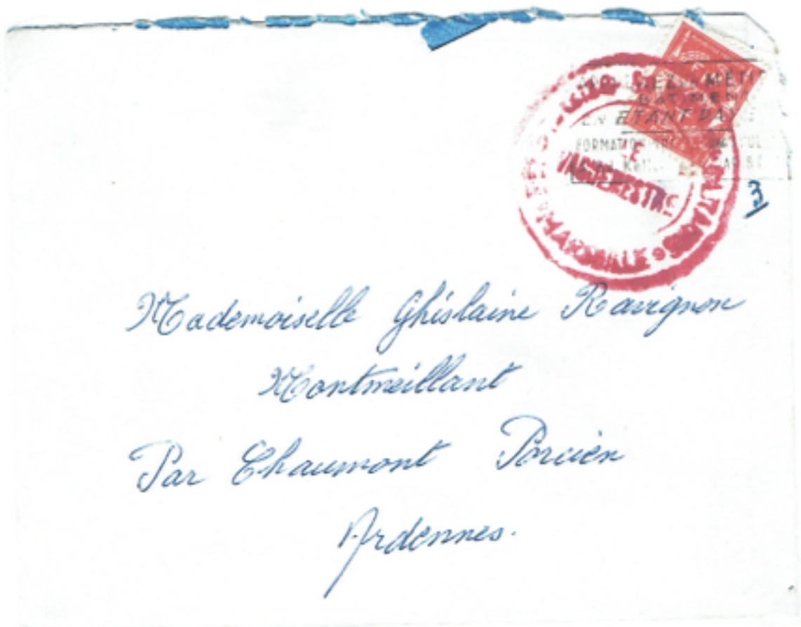
Lettre revêtu du timbre FM rouge et le cachet du régiment. Le cachet du régiment devait oblitérer le timbre FM