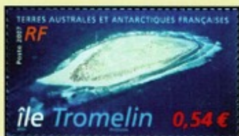
2007 - Ile Tromelin (Y.T. No 472)

Cette terre française fait partie des îles Éparses, cinquième district des Terres Australes et Antarctiques Françaises (depuis la loi du 21 février 2007). Ce confetti de sable, fortement méconnu du grand public, fut pourtant, au 18ème siècle, le théâtre d'un drame humain gravé à tout jamais dans la mémoire collective.