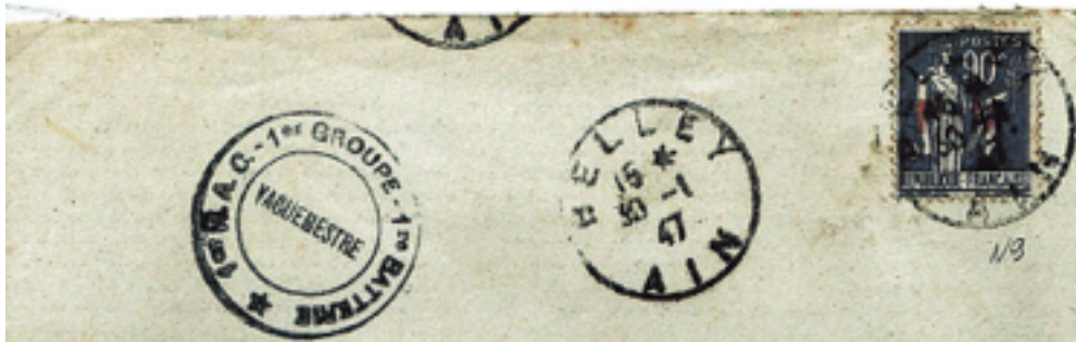
Lettre du 30/1/47 90 c type Paix Surchargé FM

Dans sa lettre du 24 mars 1948 le secrétaire d'Etat aux postes, télégrammes et téléphones stipule « que seuls les timbres-poste « FM » de couleur rouge conservaient le pouvoir d'affranchissement des lettres des militaires »