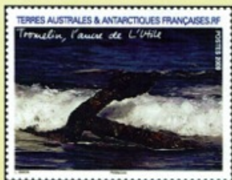
2009 - Ancre de l'Utile (Y.T. No 550)