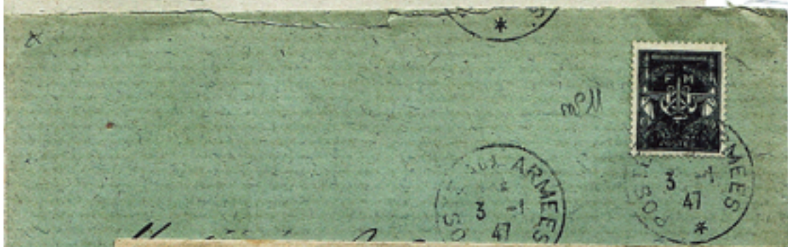
Lettre du 3/1/47 Type Emblème Vert foncé