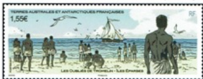
2017 - Les oubliés de Tromelin