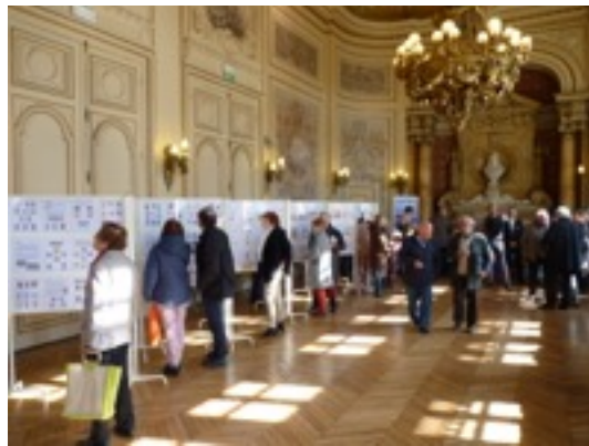
A Sens, l'exposition séduit le public