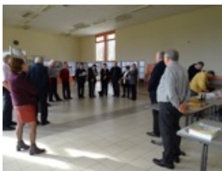
Inauguration avec le CPVC