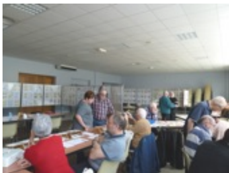
La fête du Timbre avec l'APHM