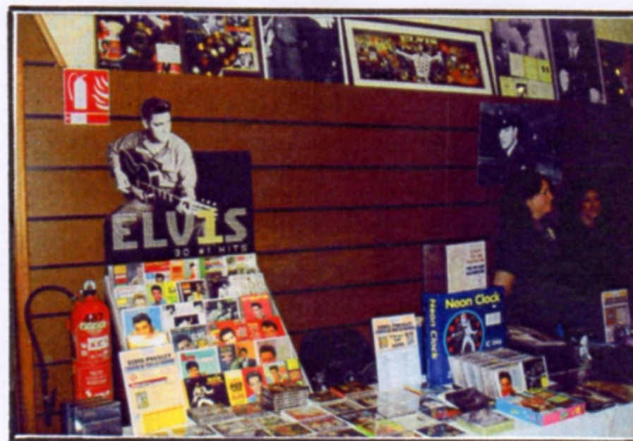
Le stand Elvis my Happiness et ses nombreux articles sur le King

Yvert et Tellier ainsi que les différents négociants ont conseillé leurs clients en les orientant vers le bon choix. Tout un éventail était proposé : catalogues, cartes postales anciennes, albums de classement, timbres et lots de timbres, ainsi que tout le matériel se rapportant à la philatélie et autres collections.