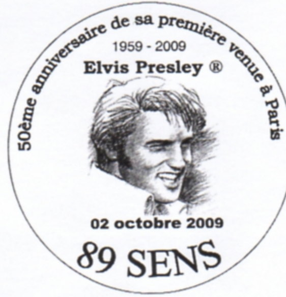
50 e anniversaire de sa première venue à Paris d'Elvis Presley