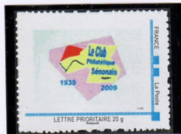
TimbraMoi 70 ans du Club