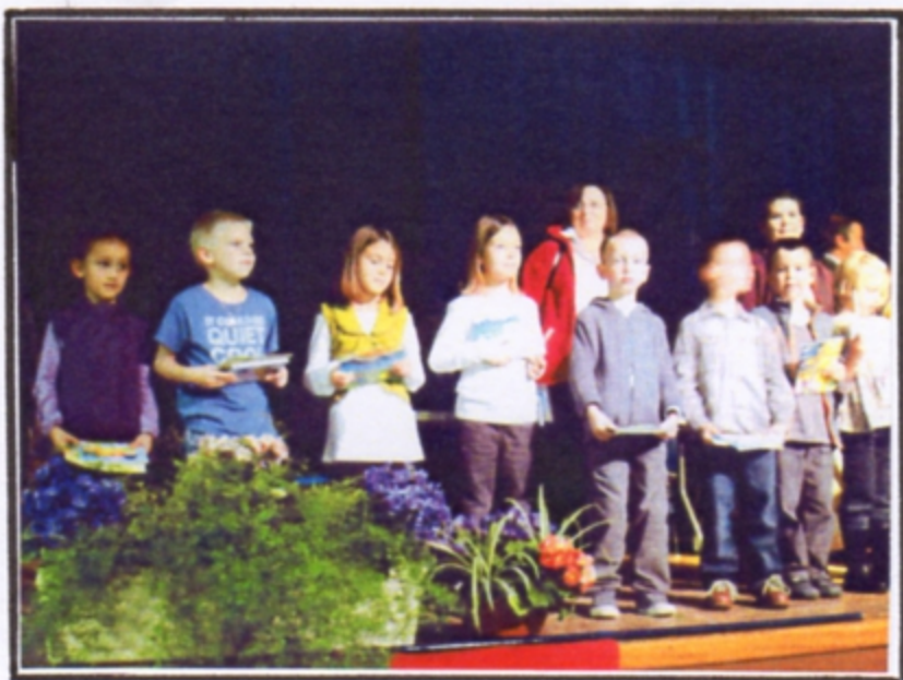
Quelques heureux gagnants sur le podium