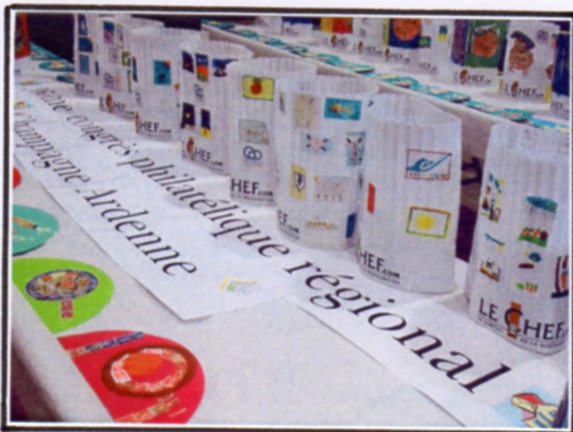
Exposition des toques et sets de table confectionnés par les élèves

La bonne humeur était de mise avec l'animation « Jeunesse » et les quatre classes participantes (trois CP et un CM2) de l'école Jeanne d'Arc de Sens. C'est avec application que les jeunes élèves ont décoré les sets de tables et les 35 toques de cuisiniers à l'aide de différents timbres et de croquis personnels. Les écoles participantes (un CE2/CM1 et un CM1/CM2) de Vouziers – Ardennes - n'ayant pu faire le déplacement, leurs travaux ont été apportés à Sens afin de participer au classement par le Jury.