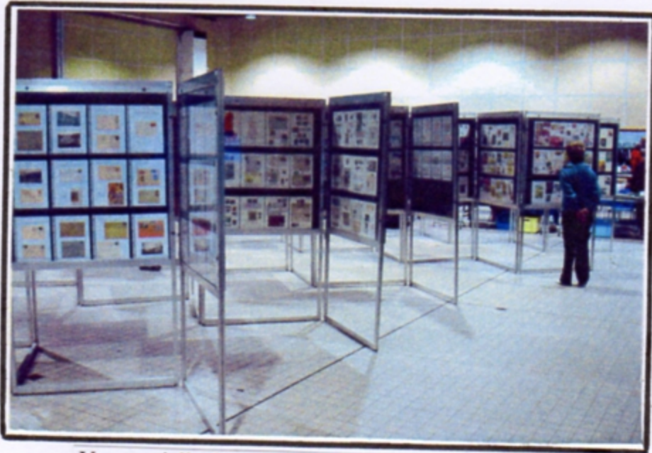
Vue partielle des cadres et des collections exposées

Du 2 au 4 octobre 2009, la Ville de Sens et le Club Philatélique Sénonais ont connu une période relativement mouvementée autour et à l'intérieur de la Salle des Fêtes René Binet.