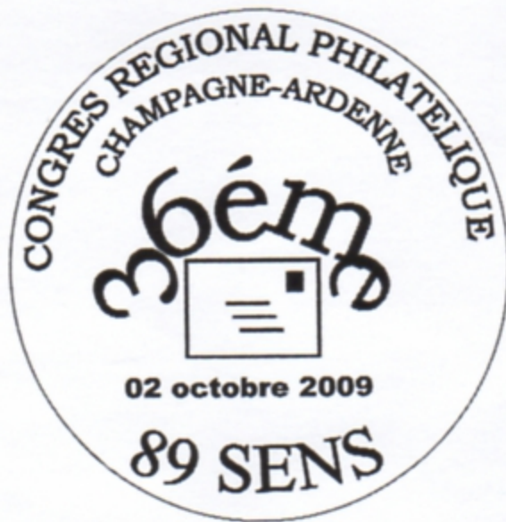
36 e Congrès régional Champagne-Ardenne