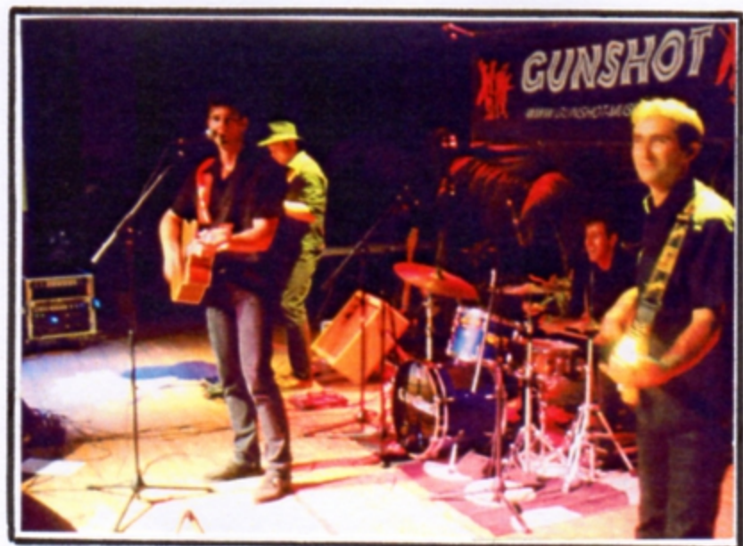
Musique pendant le dîner du Palmarès avec GUNSHOT dans une ambiance surchauffée ...