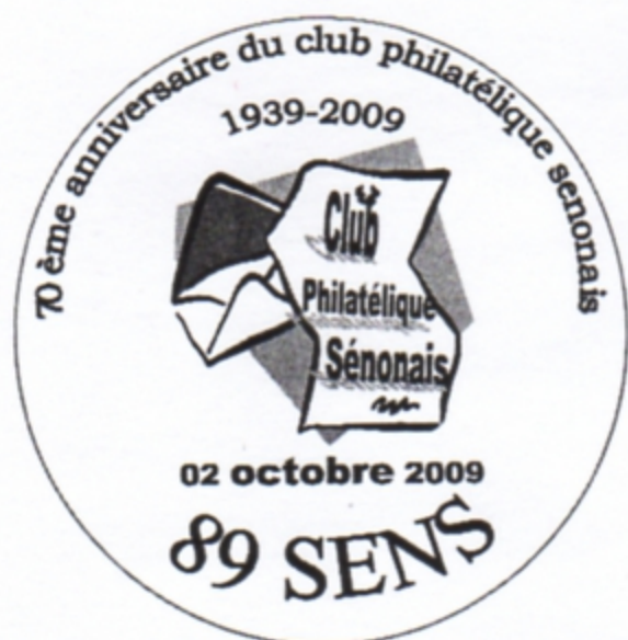
70 e anniversaire du Club philatélique sénonais

Les 3 timbres « grand format illustré » du bureau de poste temporaire :