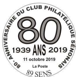
TAD 80 ans

Visuels pouvant subir des modifications selon la validation