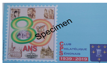
Carte postale 80 ans