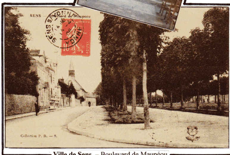
Ville de Sens – Boulevard de Maupéou et église sainte Mathie au fond

Dénommée église saint Didier lors de sa construction au IX e siècle, elle commémore ce saint, évêque de Vienne, assassiné par les sbires de la reine Brunehaut, dont il avait critiqué l'inconduite. L'église faisait partie des 17 paroisses de la ville et se trouve en dehors des remparts. Brûlée en 1015, reconstruite et démantelée pendant la guerre de Cent Ans, elle est restaurée à la fin du XV e siècle et rasée en 1567.