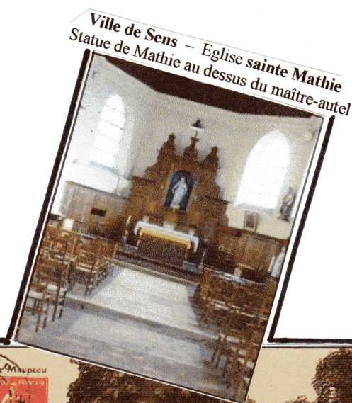
Ville de Sens – Eglise sainte Mathie Statue de Mathie au dessus du maître-autel

A l'angle du boulevard Maupéou et de la rue Carnot se dresse une église. Habituellement fermée, elle n'est ouverte que pour quelques cérémonies et messes épisodiques. Sur le pan coupé, une plaque rappelle que Jeanne d'Arc est venue s'y recueillir lors de son passage à Sens en 1429.