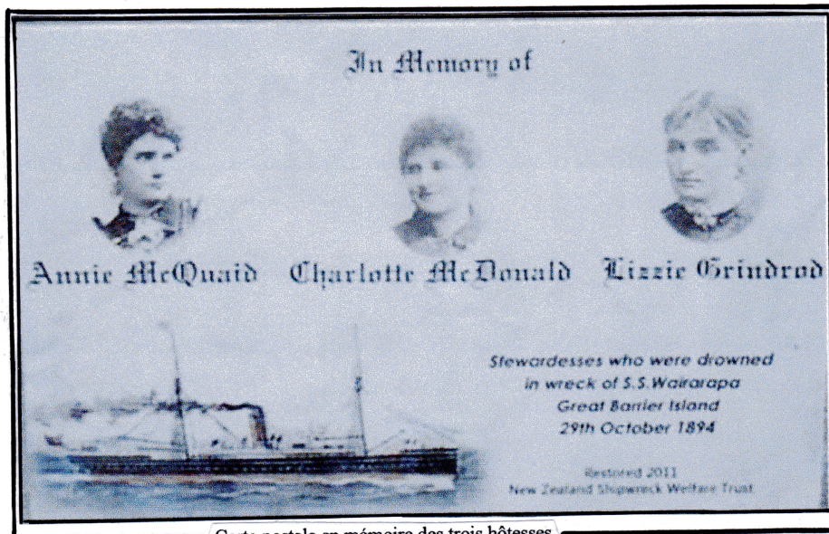
Carte postale en mémoire des trois hôtesse disparues lors du naufrage le 29 octobre 1894 Portraits et profil du SS Wairarapa

L'île, la plus grande du golfe d'Hauraki, va se retrouver encore plus isolée en 1894 lors du naufrage du SS Wairarapa au large de ses côtes, faisant 121 victimes, dont 42 corps non retrouvés. La nouvelle du naufrage n'arrivera à Auckland que trois jours plus tard.