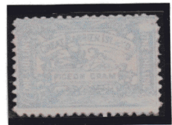
Timbre de août 1899 avec textes modifiés

En juin 1899, les timbres restants reçoivent la surcharge « Pigeongram » qui recouvre complètement la banderole et les mots « Special Post ».