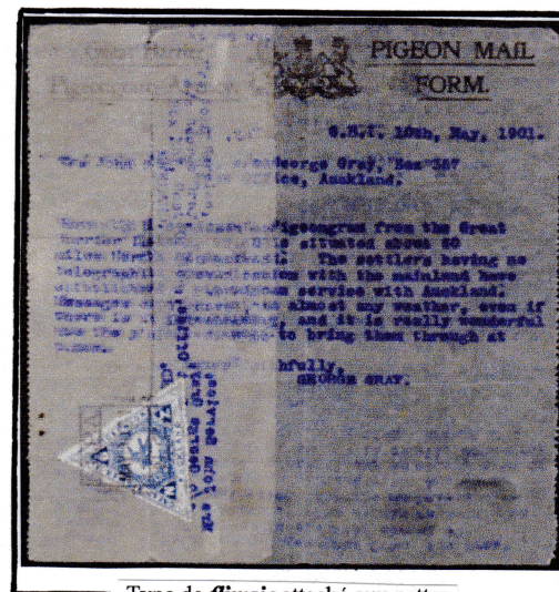
Type de flimsie attaché aux pattes des pigeons lors du vol

Les messages sont écrits sur du papier extrêmement léger, scellés avec un timbre et attachés par un fil de coton) la patte du pigeon. Ce dernier peut emporter jusqu'à 4 plis par voyage, et la cadence est de 6 à 8 pigeons par semaine. Ces messages sont connus sous le nom de flimsies .