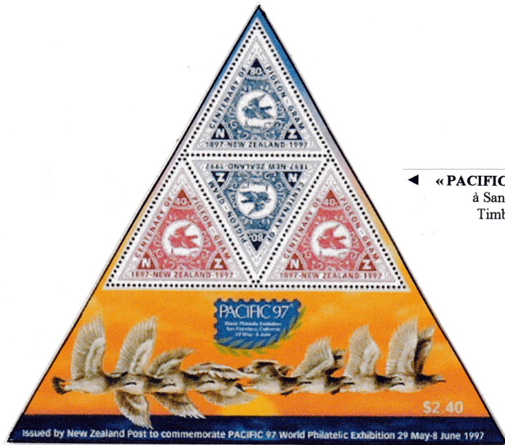
◀ « PACIFIC '97 » - Exposition philatélique internationale à San Francisco (Californie) du 29 mai au 8 juin 1997 Timbres de même date réunis sur feuillet triangulaire B.F. n° 115 - (Yvert et Tellier)

Au cours de deux expositions en 1997, PACIFIC 97 et AUPEX '97, la Poste de Nouvelle-Zélande a émis deux feuillets triangulaires avec les quatre timbres de 40 et 80 c présentés sous la forme d'un triangle.