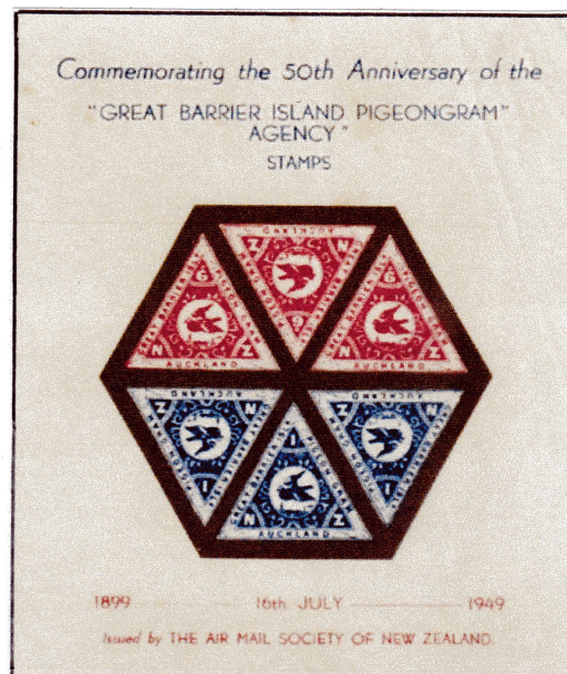
Bloc-feuillet commémoratif pour les 50 ans de Great Barrier Island Pigeongram Agency (16 juillet 1899 – 16 juillet 1949) 3 timbres de 6p et 3 timbres de 1/

En 1994, pour célébrer le souvenir du naufrage du SS Wairarapa , un feuillet commémoratif de six timbres a été émis pour le centenaire. C'est uniquement un objet de collection car il n'a aucune valeur pour une utilisation postale normale.