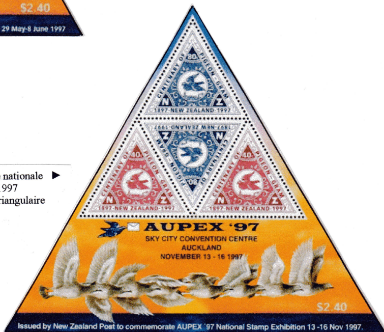
▶ « AUPEX '97 » - Exposition philatélique nationale à Auckland (N.Z.) du 13 au 16 novembre 1997 Timbres de même date réunis sur feuillet triangulaire B.F. n° 119 - (Yvert et Tellier)