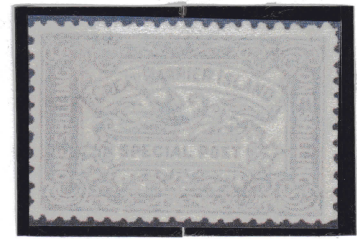
Nouveau timbre de mars 1899 Great Barrier Island – Special Post