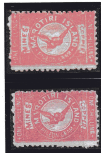
Nouveau timbre des Copper Mines ► Émis en septembre 1899 Couleur rouge ou carmin

En septembre 1899, pour ce nouveau service, un nouveau timbre est émis. Pigeon portant une lettre au centre, il comporte les mentions « Marotiri Island – Pigeongram », encadrées de « Mines Copper » et de la valeur de 1 shilling. Émis en rouge, il comporte une variante en carmin.