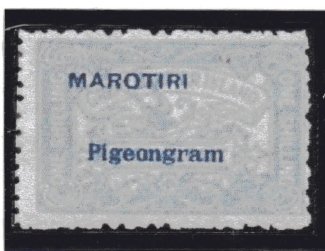
Timbre de juin 1899 avec nouvelle surcharge MAROTIRI en août 1899

En août 1899, refonte du timbre et réédition en gardant même design, même valeur, même couleur mais avec les nouveaux textes.