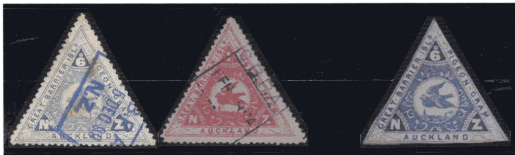
Timbres triangulaires de 6 p et 1/ émis en juillet 1899 par Great Barrier Island Pigeongram Agency (représentation dentelée et non-dentelée)

En juillet 1899, la société de Walter Ficker commence également à émettre des timbres prépayés. D'un commun accord entre les deux sociétés, le tarif de Great Barrier Island à Auckland est réduit à six pence. De forme triangulaire avec un pigeon volant au centre, les trois côtés reprennent l'inscription « Great Barrier Isld – Pigeon-Gram – Auckland » tandis que l'angle supérieur reçoit la valeur et les angles inférieurs les lettres « N » et « Z » pour New Zealand Bleu pour le 6 p et rouge pour le 1/, ils existent en dentelés et non-dentelés.