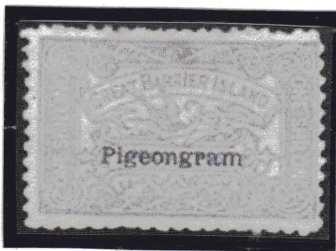
Timbre de mars 1899 avec surcharge Pigeongram de juin 1899