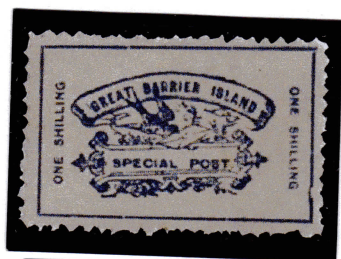
1 er timbre émis en 1898 et utilisé par Great Barrier Island Postal Pigeon Service Encre bleue sur fond blanc Papier mince gommé