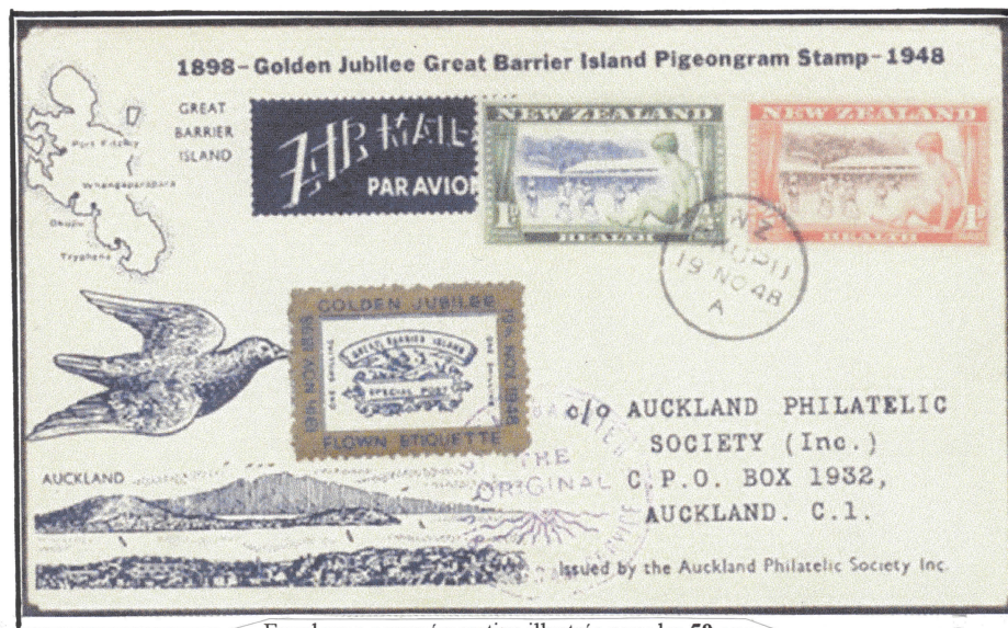
Enveloppe commémorative illustrée pour les 50 ans du 1 er timbre Pigeongram (19 novembre 1898 – 19 novembre 1948)

En 1948, la Société philatélique d'Auckland a marqué le Jubilé du 1 er timbre émis par un Pigeongram d'origine encadré d'un bandeau ton or.