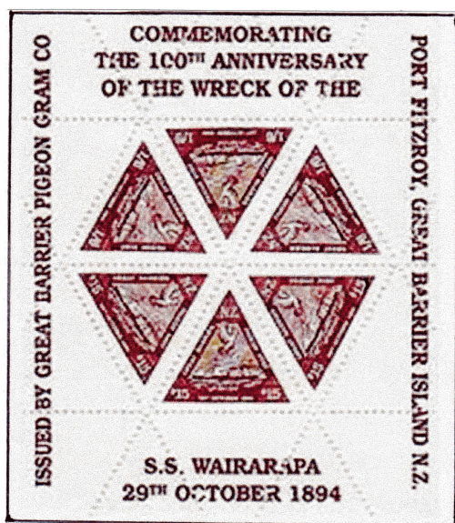
Bloc-feuillet commémoratif pour les 100 ans du naufrage du SS Wairarapa 3 timbres de 15p et 3 timbres de 1/6 (non valable pour utilisation postale)

En 1949, la Société de la Poste aérienne de Nouvelle-Zélande a émis un bloc-feuillet avec six timbres pour marquer les 50 ans de Great Barrier Island Pigeongram Agency . Les couleurs des timbres ont été inversées par rapport aux originaux pour éviter les confusions.