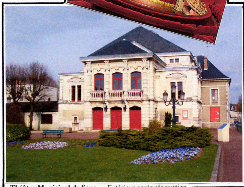
Théâtre Municipal de Sens – Extérieur après rénovation

Le Théâtre municipal de Sens aurait donné son premier spectacle en 1808. Stéphane Mallarmé, spectateur assidu, tenait en 1861 et 1862 la rubrique théâtrale du journal « Le Sénonais ».