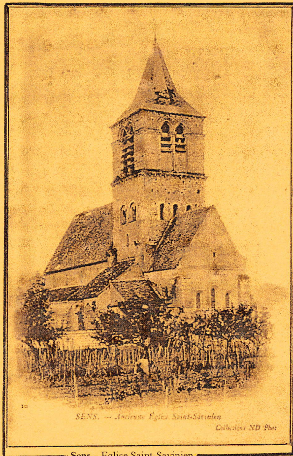
SENS. — Ancienne Eglise Saint-Savinien