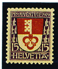
1919 - 15c.+15c. Blason Y.T. N° 175