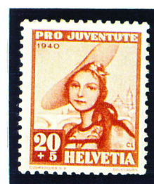
1940 - 20c.+5c. Jeune fille de Soleure Y.T. N° 356