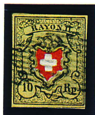
1850 10 Rp. Rayon II Y.T. N°15