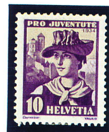
1934 - 10.cent. Jeune fille du Valais Y.T. N° 279