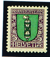
1925 - 5c.+5c. Blason Y.T. N° 218