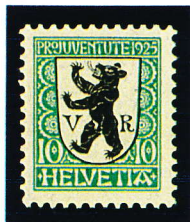
1925 - 10c+10c. Blason Y.T. N°219