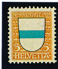
1922 - 5c.+5c. Blason Y.T. N° 188