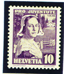
1936 - 10 cent. Jeune fille de Neuchâtel Y.T. N°199