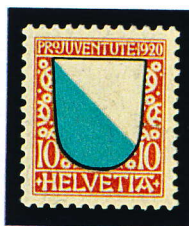
1920 - 10c.+10c. Blason Y.T. N° 177