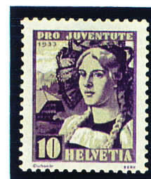
1933 - 10cent. Bernoise Y.T. N°268