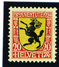
1924 - 20c+20c Blason Y.T. N° 216

Capitale : SCHAFFHOUSE Langue : Allemand