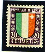
1923 - 20c.+20c. Blason Y.T. N° 194