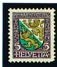
1926 - 5c.+5c. Blason Y.T. N° 222