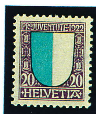
1922 - 20c. 20c. Blason Y.T. N°190