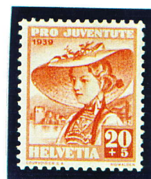
1939 - 20c.+5c. Jeune fille de Nidwald