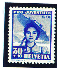
1940 - 30c.+10c. Jeune fille de Zoug Y.T. N° 357