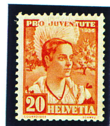
1936 - 20 cent. Jeune fille de Schwyz. Y.T. N° 300