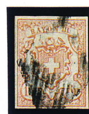
1852 15 Rp. Rayon III Y.T. N°23

- SUISSE : de SCHWITZ , nom d'un de ses Cantons