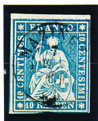
1854 10 Rp. Helvétia Y.T. N°27