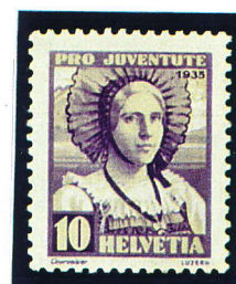
1935 - 10 cent. Lucernoise Y.T. N° 283