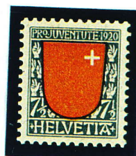
1920 - 7.1/2.+7.1/2c. Blason Y.T. N° 176