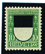
1922 - 10c+10c. Blason Y.T. N°189

Capitale : FRIBOURG Langues : Allemand Français.