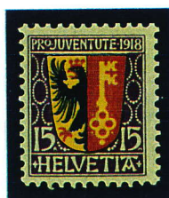
1918 - 15c+15c. Blason Y.T. N°169