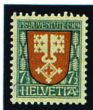
1919 - 7.1/2.+7.1/2c. Blason Y.T. N° 173