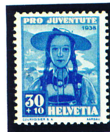
1938 - 30c.+10c. Argovienne Y.T. N°319