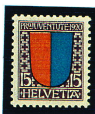
1920 - 15c.+15c. Blason Y.T. N° 178