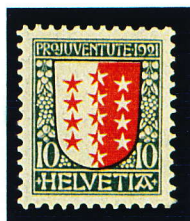
1921 - 10c.+10c. Blason Y.T. N° 185

Capitale : Sion Langues : français allemand