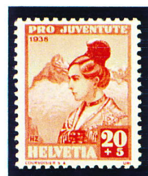
1938 - 20c.+5c+ Jeune fille d'Uri Y.T. N° 318