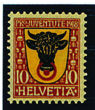
1918 - 10c.+10c. Blason Y.T. N° 168