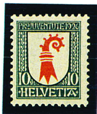
1926 - 10c+10c. Blason Y.T. N°223