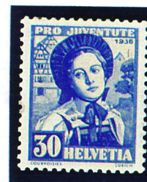
1936 - 30.cent. Jeune fille de Zurich Y.T. N° 301