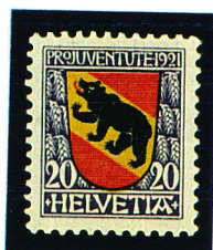
1921 - 20c+20c. Blason Y.T. N°186

Capitale : BERNE Langues : Allemand Français