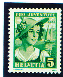
1933 - 5.cent. Vaudoise Y.T. N° 267