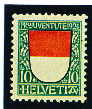
1924 - 10c.+10c. Blason Y.T. N° 215