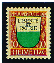
1919 - 10c.+10c. Blason Y.T. N° 174