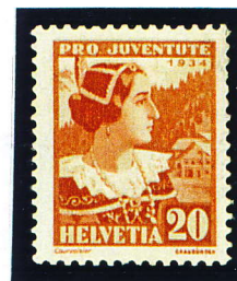
1934 - 20cent. Jeune fille des Grisons Y.T. N°280