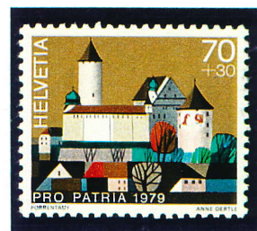
1979 - 70c.+30c Porrentruy Y.T. N°1088