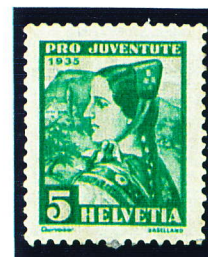
1935 - 5cent. Bâloise Y.T. N°282