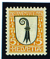
1923 - 5c.+5c. Blason Y.T. N°192