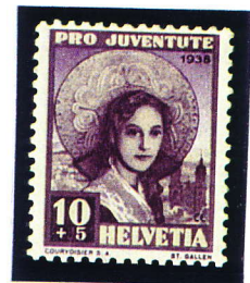
1938 - 10c.+5c. Jeune fille de Saint-Gall Y.T. N°317