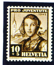
1981 - 10c.+5c. Appenzelloise. Y.T. N°381