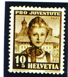
1941 - 10c.+5c. Jeune fille de Schaffhouse Y.T. N°372