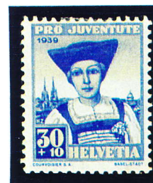
1939 - 30c.+10c. Bâloise Ville Y.T. N°347