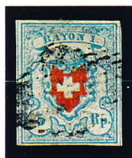
1851 5 Rp. Rayon I Y.T. N°20