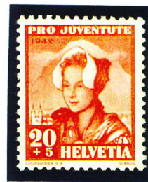
1942 - 20c.+5c. Villageoise Y.T. N°182