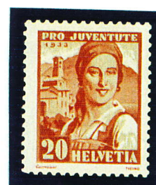
1933 - 20 cent. Tessinoise Y.T. N° 269