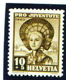
1940 - 10c.+5c. Thurgovienne Y.T. N° 355