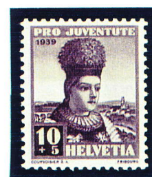
1939 - 10c+5c. Fribourgeoise Y.T. N°345