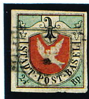
1845 2.1/2 Rp.

Capitale : BALE Langue : Allemand Adhésion à la Confédération en 1501