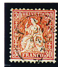
1862 30 Rp. Helvétia Y.T. N°38

- La SUISSE n'a pas de langue unique, on y parle : le Français, l'Allemand, l'Italien, et le Romanche.