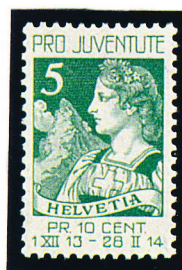
1913 5+5 cent. Helvétia Y.T. N°137