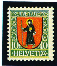
1923 - 10c+10c Blason Y.T. N°193