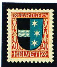
1926 - 20c+20c. Blason Y.T. N°224