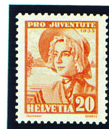
1935 - 20cent. Genevoise Y.T. N°284