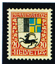
1925 - 20c.+20c Blason Y.T. N°220

Capitale : COIRE Langues : Allemand Italien Romanche