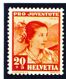
1941 - 20c.+5c. Jeune fille d'Obwald Y.T. N° 373